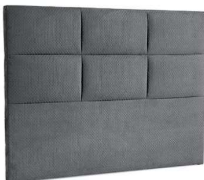
CABECEIRA RETANGULAR C/ LISO