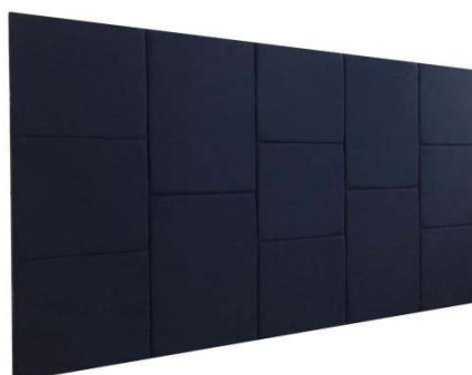
CABECEIRA PAINEL BLOCOS