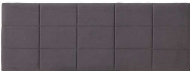
CABECEIRA PAINEL RETANGULAR