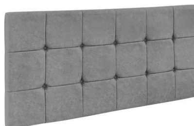
CABECEIRA RETANGULAR C/ CAPITONÊ