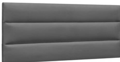
CABECEIRA PAINEL LINHAS